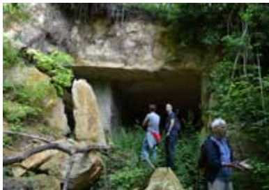
Carrière à Magny-en-Vexin