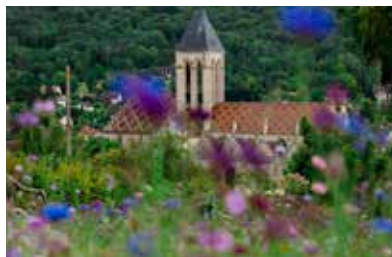
Eglise Notre-Dame à Vétheuil