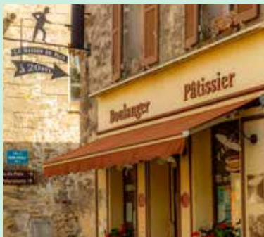
Maison du pain à Commeny

maisondupaincommeny@gmail.com ou 09 88 18 63 97