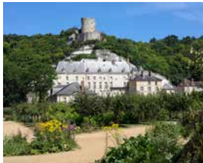
Château de la Roche-Guyon

Exposition de l'association paroissiale de Juziers dans l'église de Juziers. L'exposition présentera l'eau dans toutes ses dimensions naturelles comme symboliques.