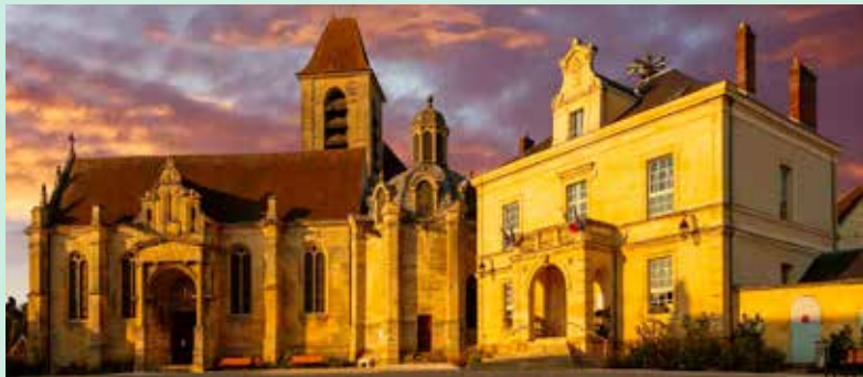
Eglise Saint-Rémi à Marines